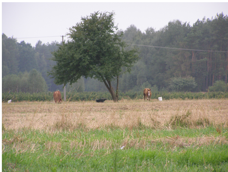
Rysunek 2. Krajobraz miejscowości Rzyczyna

Na terenie miejscowości Rzyczyna nie występują obszary o międzynarodowej i krajowej randze przyrodniczo-krajobrazowej oraz wchodzące w skład Ekologicznego Systemu Obszarów Chronionych.