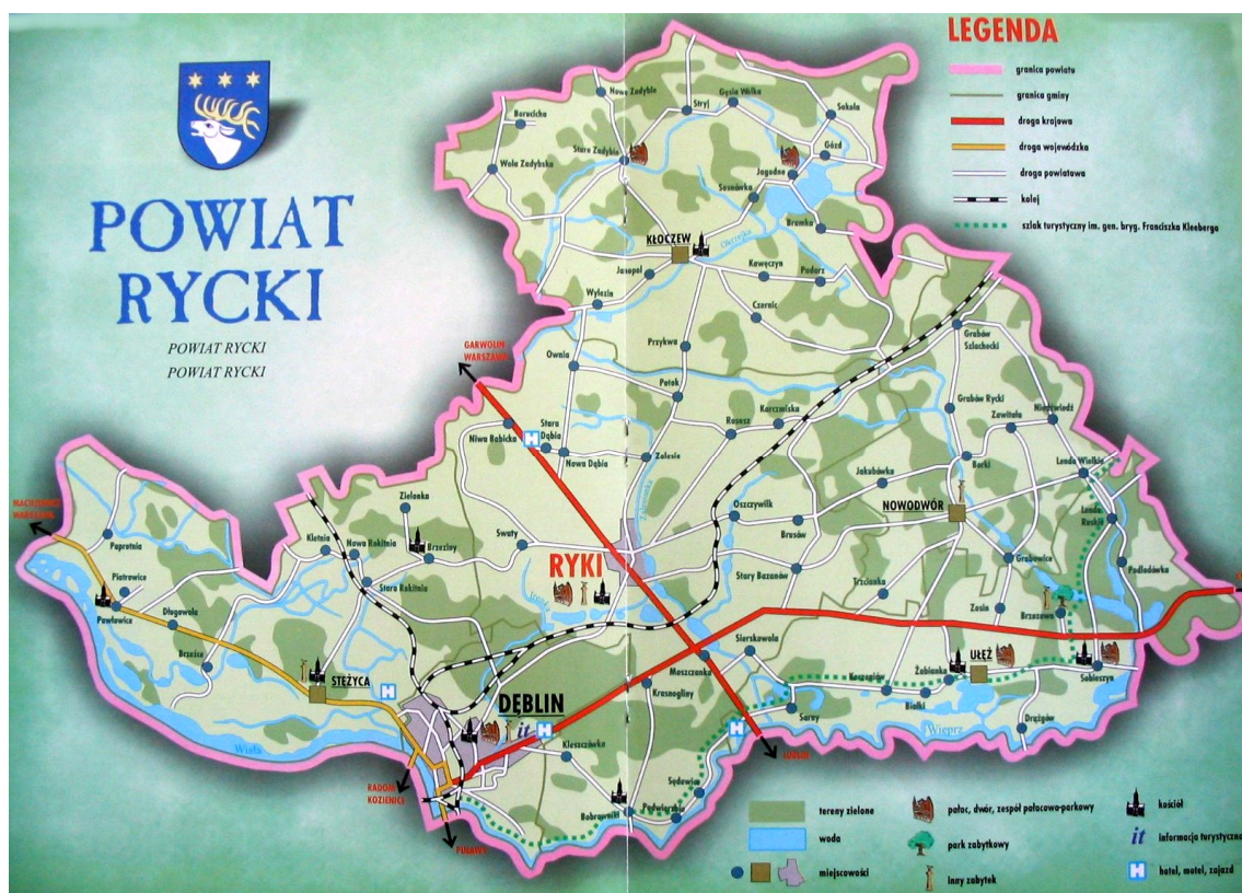
Rysunek 2. Położenie miejscowości Kłoczew na tle powiatu ryckiego