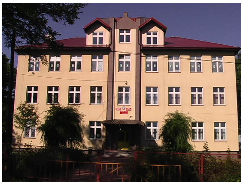
Rysunek 4. Zespół Szkół w Kłoczewie