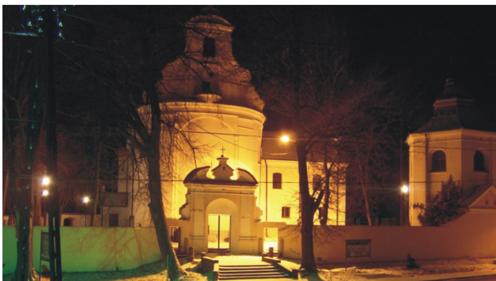
Rysunek 3. Zespół Kościoła Parafialnego z przełomu XVII-XVIII w p.w. Jana Chrzciciela w Kłoczewie