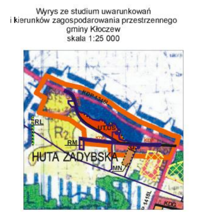
Wzys z studium uwarunkowań i kierunków zagospodarowania przestrzennego gminy Kłoczew skala 1:25 000

Biuro Kartograficzne "PRYZMAT" ul. Sienkiewicza 10, Lublin 20-030 tel. 716 251 74 20, Regon: 06197042