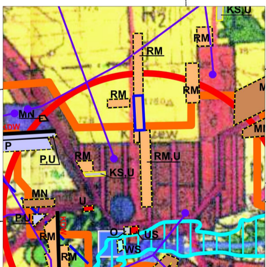
Wyrys ze studium uwarunkowań i kierunków zagospodarowania przestrzennego gminy Kłoczew skala 1:25 000

granice terenów objęte zmianą miejscowego planu zagospodarowania przestrzennego gminy Kłoczew – etap III